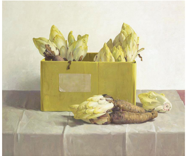
Witlof in Gele doos (1992)

Na exposities in de Verenigde Staten (Washington, New York), Taiwan, Duitsland, Tsjechië, Maleisië, Engeland, Frankrijk en Indonesië, wordt de wereldtournee van de grote kunstenaar Henk Helmantel voortgezet in Zeist. Helmantel zal daar zijn schilderijen van 12 januari t/m 14 maart 2010 tentoonstellen in het Slot Zeist.